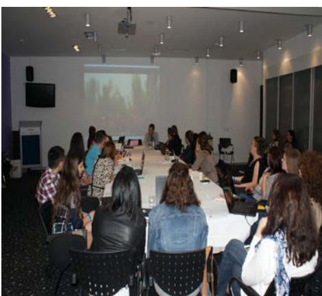
Sa prvog seminar a Strateško planiranje razvoja socijalnih usluga 22-24.04.2016. Ulcinj